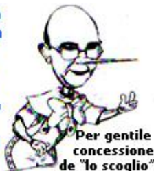
Per gentile concessione de "lo scoglio"