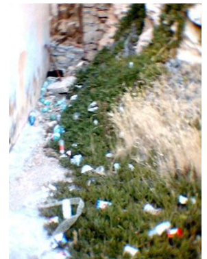
Si sa però che questo tipo di mondezza puzza un po' e sporca pure le manine !