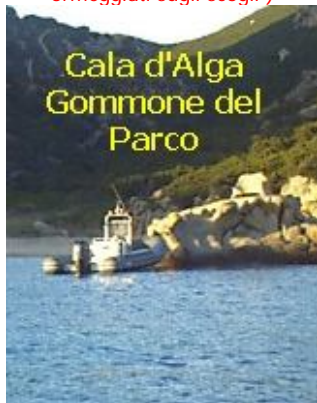
© Yaril Tonno (tra una rete e l'altra)