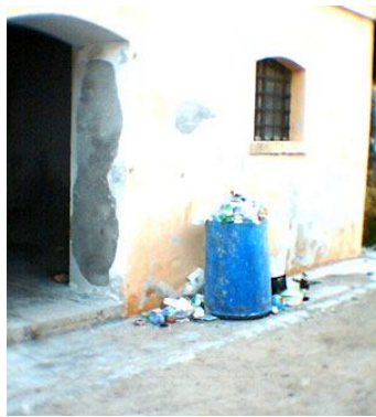
Cala Corsara il giorno che facevano finta di pulire Cala d'Alga. ( con i loro gommoni ormeggiati sugli scogli )